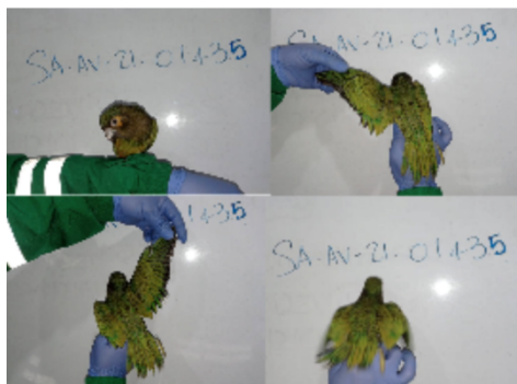
Fotos 4,5, 6 Y 7. Oficina de Enlace de Secretaría Distrital de Ambiente, evaluación de un individuo vivo de Cotorra carisucia ( Eupsittula pertinax ). FC-SA-21-0649 y SA-AV-21-1435. AI 161167.

En el momento de la valoración preliminar del estado del individuo, se determinó que era un ejemplar vivo, juvenil, de sexo indeterminado, de actitud alerta, dócil y habituado al ser humano, condición corporal de 3/5 y con las plumas primarias y secundarias cortadas, también evidencia líneas de estrés en el plumaje.